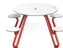
ZOID - R

Round table with integrated seats, consisting of a tubular frame with an HPL top and four supports in round steel tube curved, onto which the round HPL seats are fixed. The table is prepared with a hole for inserting a parasol. All metal parts are galvanised and coated with thermosetting polyester powder. All fixings are in AISI304 stainless steel. Prepared with holes for ground fixing through mechanical dowels (not included).