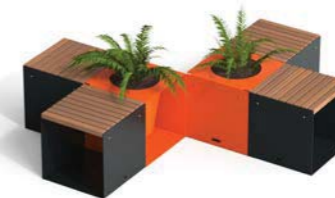
N. 2 CUBIK - F + N. 4 CUBIK - W