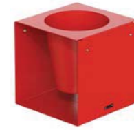
CUBIK - F