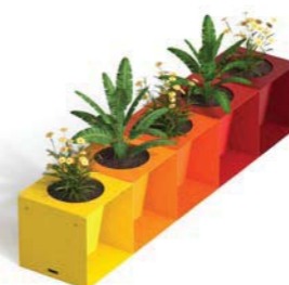
CUBIK - H