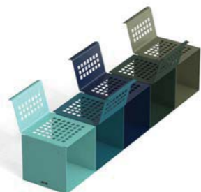
N. 4 CUBIK