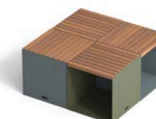
N. 4 CUBIK - W