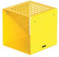
CUBIK - P