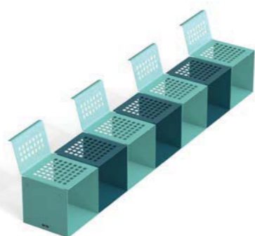
N. 4 CUBIK + N. 4 CUBIK - P