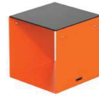
CUBIK - H