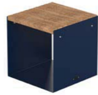
CUBIK - W