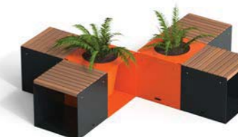
N. 2 CUBIK - F + N. 4 CUBIK - W