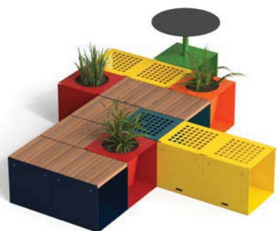
N. 4 CUBIK - W + N. 3 CUBIK - F N. 4 CUBIK - P + N. 1 CUBIK - T