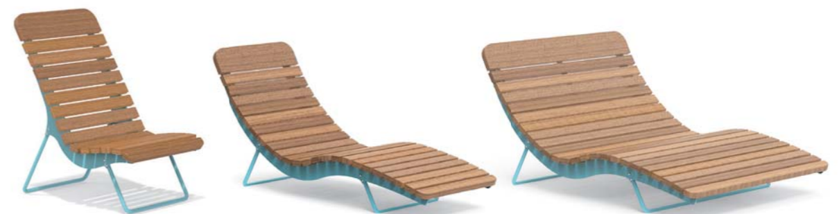
BOJON - A

Chaise longue with galvanized and powder coated steel structure, seat and backrest in exotic hardwood slats or larch wood slats, with supports in round galvanized and powder coated steel. Available in single or double version or armchair.